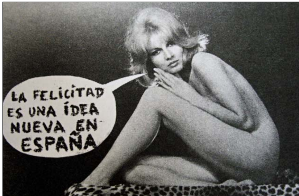
Guy Debord, «Carte de Paris avant 1957» (1957), cartolina erotica inviata dall'Internazionale situazionista nel 1964 in Spagna, modificata con l'introduzione di slogan politici come gesto di opposizione alla dittatura di Francisco Franco

Il visitatore era così, implicitamente, invitato a compiere una sorta di «deriva» tra i materiali stratificatisi nei 25 anni di attività dell'IS e delle formazioni che la precedettero e generarono (CoBrA, MIBI, Internazionale Letterista), ad abbandonare a più riprese il filo rosso debordiano, del resto non lineare né cronologico, per esplorare ambiti creativi paralleli ma non sempre affini. Gli spettacolari plastici, gli oli, i fotomontaggi e le incisioni, attraverso cui l'artista-architetto olandese Constant Nieuwenhuys elaborò «New Babylon», progetto continuo di una città ludica per un'umanità nomade; i quadri, le ceramiche, i collages e le stampe del danese Asger Jorn, di Gil Wolman, di Ivan Chitchevlov o di Giuseppe Pinot Gallizio, ma anche un gran numero di pubblicazioni, di volantini politici frequentemente realizzati in forma di fumetto o fotomontaggio, tra cui le cartoline politico-erotiche inviate alla Spagna franchista, davano conto della vastità e dell'eterogeneità dell'attività del movimento nei diversi paesi. Leonardo Lippolis, studioso ge-